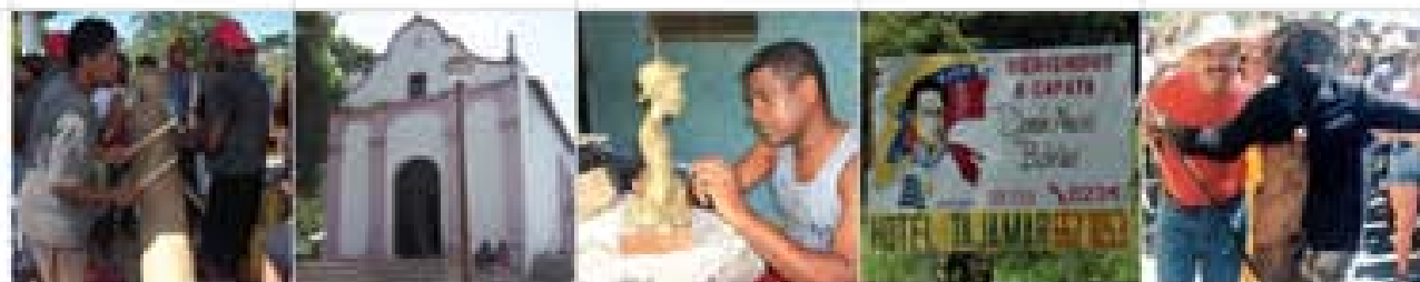
1 LOS OBJETOS